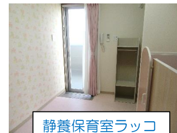
静養保育室ラッコ