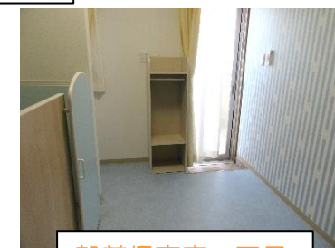
静養保育室コアラ