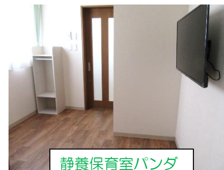
静養保育室パンダ